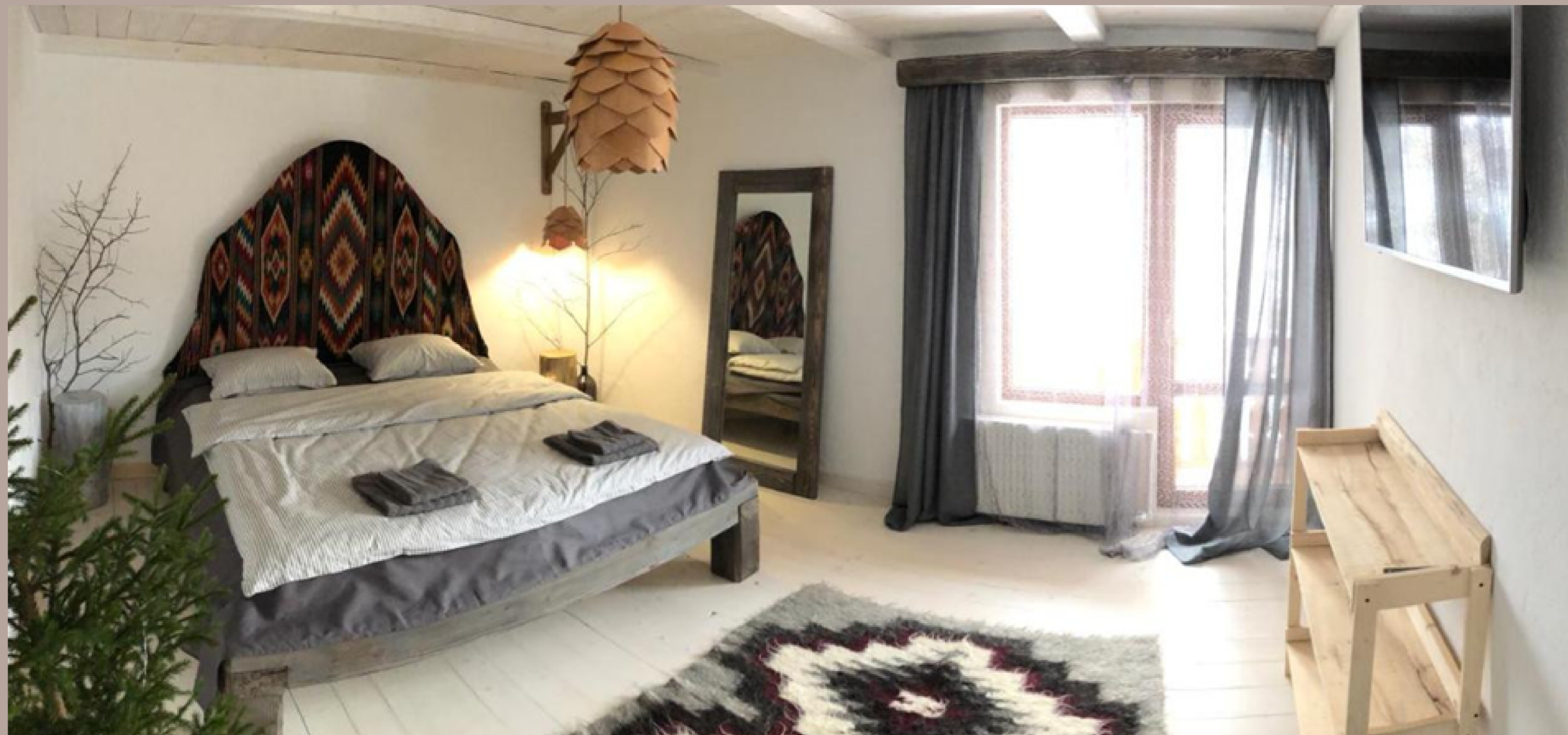
Готель «Карпатська Казка»

Український стиль можна вважати найцікавішим етнічним стилем. Його створення відбулося завдяки археологічній культурі, пов'язаній зі спадщиною мистецтва та культурою пращурів.