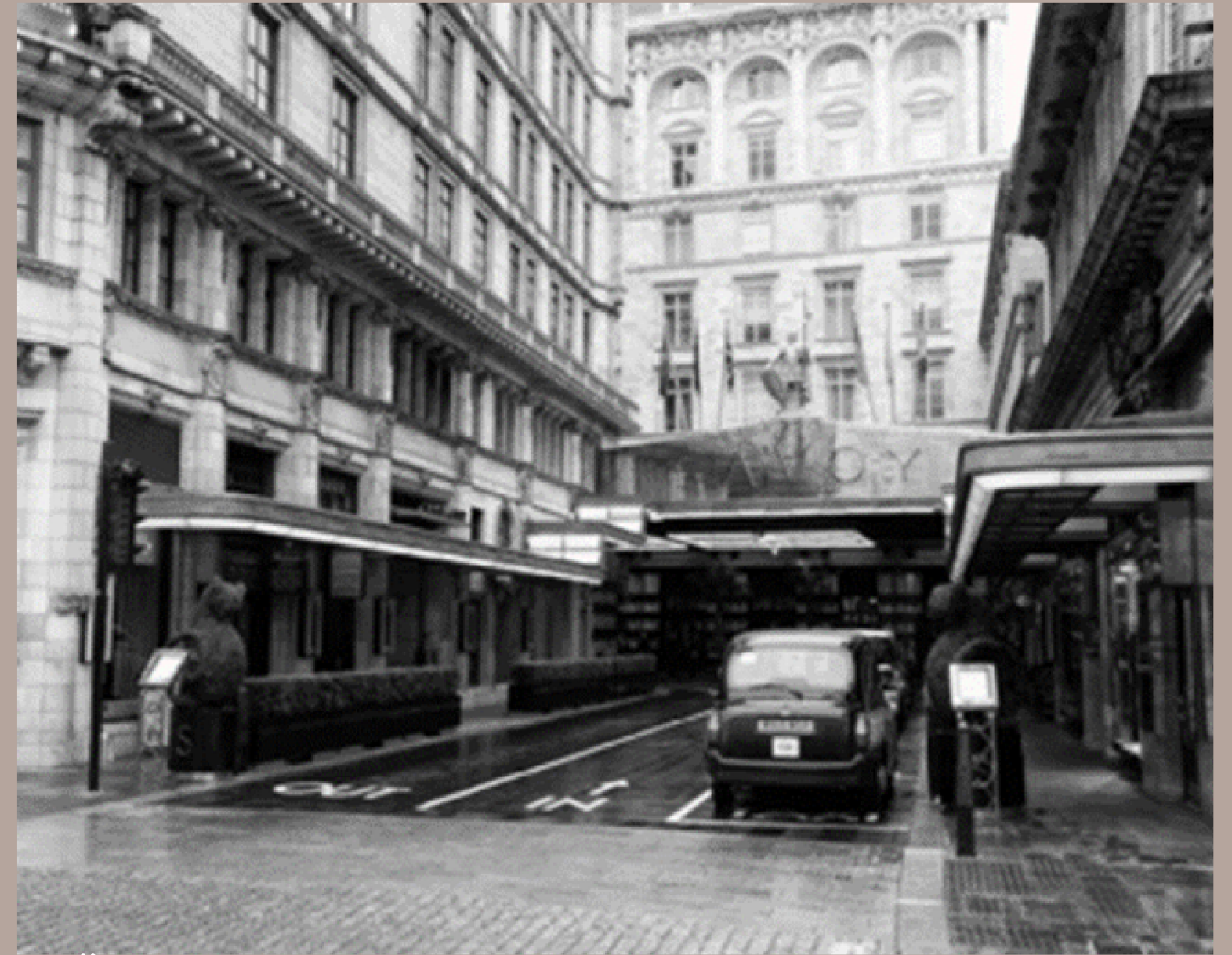
Рис. 1.1. Готель Savoy

. У 1889 році в Лондоні відкрився готель «Савой» (рис. 1.1), яким керував Цезар Рітц (зараз входить до мережі готелів «Рітц-Карлтон») [25].