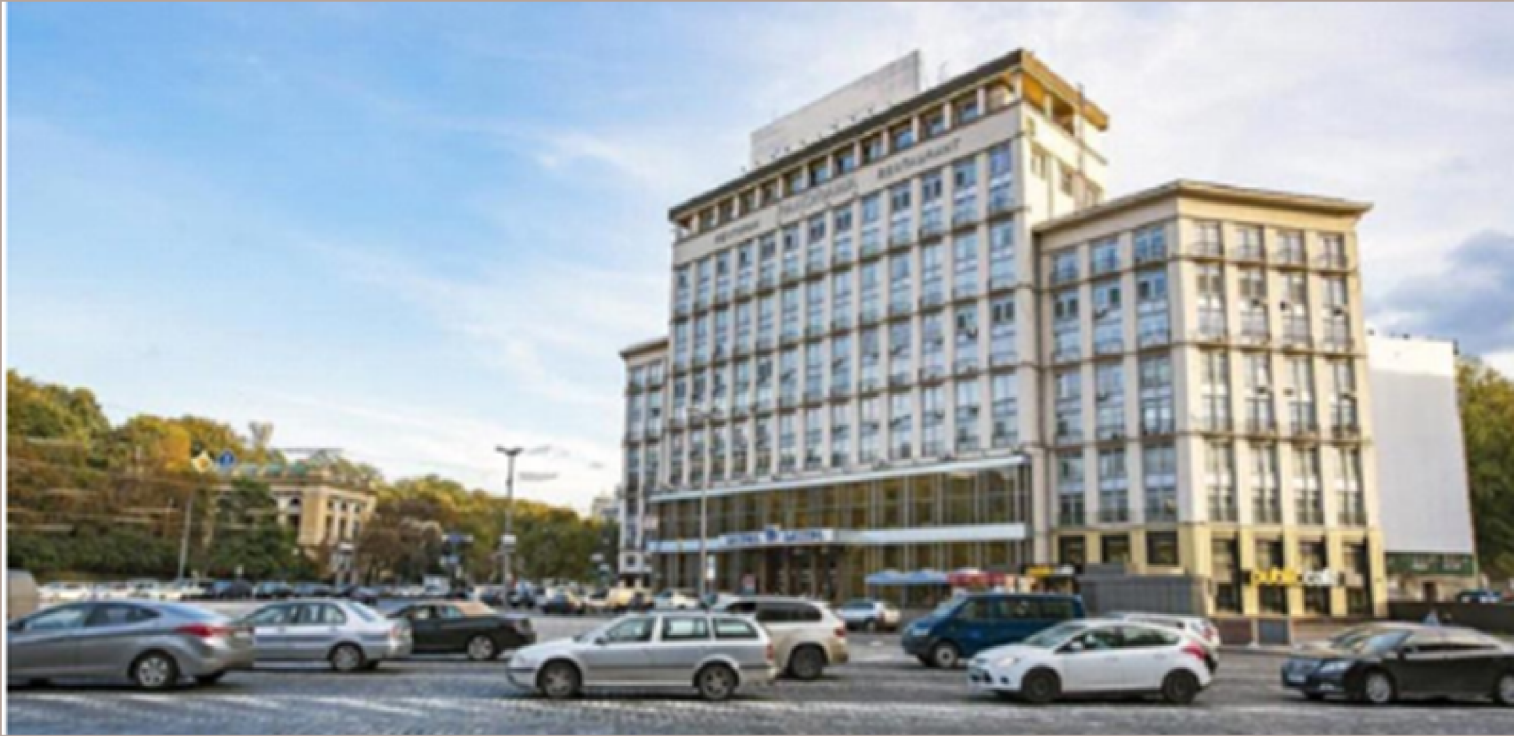
Рис. 1.2. Готель “Дніпро”

70–90–ті роки XIX століття були важливим періодом для Києва через залізничне сполучення з багатьма містами, що збільшило кількість гостей, які приїжджали на роботу та відпочинок. Готель «Франсуа», збудований у 1890 році, готель «Палац» 1908 року, готель «Марсель», пізніше перейменований на «Дніпро» та «Національний» (рис. 1.2), вважаються готелями дуже високої якості, престижними та елітними.