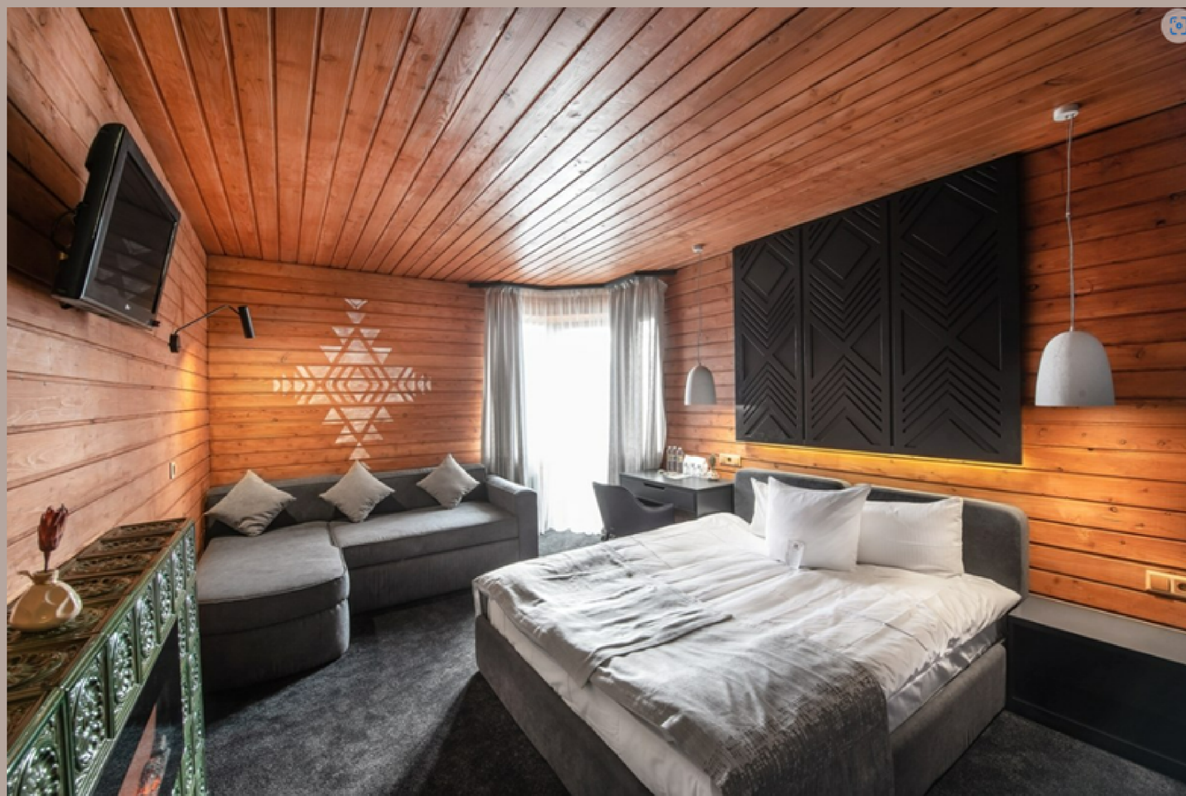
Готель «Стара Правда» в Буковелі