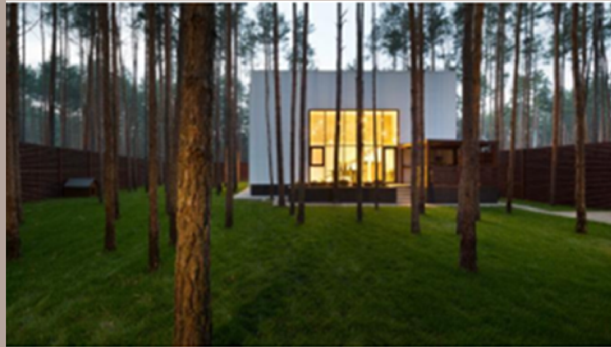
Рис. 1.6. Дім "Куб"